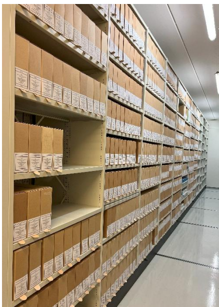
Arkiver fra Kirkeparken VGS, depot 1.

Året har vært preget av store mottak av papirarkiver, og en videre oppbygging av digitaliseringsenheten som digitaliserer bygge- og eiendomsarkiver.