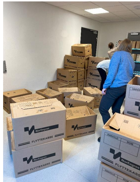
Mottak av arkiver fra Sarpsborg kommune.