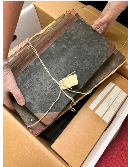
Henting av muggskadde arkiver i Nes kommune.

Ordningsoppdrag for Sarpsborg kommune som løper fra 2020-2027 har pågått igjennom hele året. Det har også vært utført noen andre ordningsoppdrag, bl.a. flere personalarkiv, samt et stort NAV-arkiv fra Sarpsborg kommune, som kom inn helt på slutten av året.